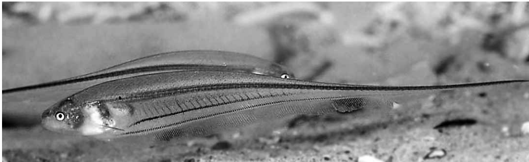
Abb. 32.1 Eigenmannia virescens (Privataquarium)

6 Familien. Einige Arten werden wegen ihres ungewöhnlichen Äußeren und ihrer interessanten Lebensweise in der Schauaquaristik z. T. regelmäßig gezeigt ( Apteronotus , Eigenmannia , Electrophorus , Steatogenys ), andere geraten gelegentlich als Beifänge nach Europa.