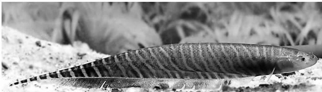
Abb. 32.4 Gymnotus spec. (Privataquarium)

Gattung Sternarchorhynchus : 4 Arten. Dazu Tapirmesseraal ( S. oxyrhynchus ): 47 cm, Amazonas, Guayana-Länder. Mit langer, röhrenförmiger und gebogener Schnauze.