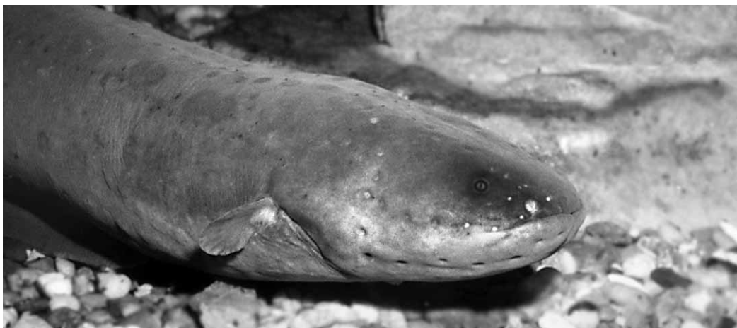
Abb. 32.5 Electrophorus electricus (Zoo-Aquarium Berlin)

Die wärmebedürftigen Nacktaale werden bei Temperaturen zwischen 24 und 28 °C in weichem Wasser (Weißwasserformen auch härteres Wasser) und einem pH-Wert um den Neutralpunkt bei nur schwacher Wasserbewegung gehalten. Alle Arten sind dämmerungs- und nachtaktiv. Bei entsprechender Beckengröße können kleinere Arten auch in Schwärmen gepflegt werden. Für große Arten ( Rhamphichthys , Gymnotus , Electrophorus ) ist meist eine Einzelhaltung in Großbecken erforderlich. Die Aquarien sollten nicht zu hell sein und als Bodengrund Sand besitzen. Für Gymnorhamphichthys ist eine hohe Sandschicht notwendig, da sich die Tiere tagsüber im Sand vergraben. Eine dichte Bepflanzung ist besonders für Apteronotus -Arten und für durchscheinende Arten wie Eigenmannia erforderlich. Bodenlebende Formen ( Steatogenys ) gehen gern in enge Röhren oder in Wurzeldickichte.