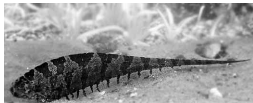
Abb. 32.2 Steatogenys elegans (Privataquarium)

Gattung Steatogenys : 2 Arten. Dazu Gesprenkelter Messerfisch ( S. elegans ): 18 - 20 cm,